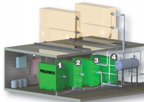
Implantation des 4 FRIGOBOX Nestlé Zimbabwe