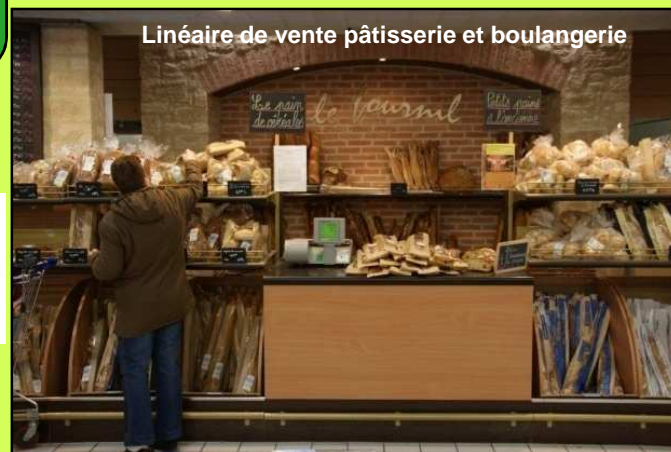
Linéaire de vente pâtisserie et boulangerie