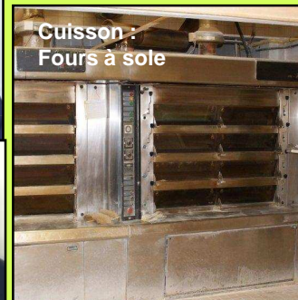
Cuisson : Fours à sole