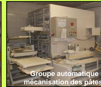
Groupe automatique : mécanisation des pâtes