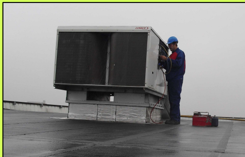
Crescendo de Blois (41)