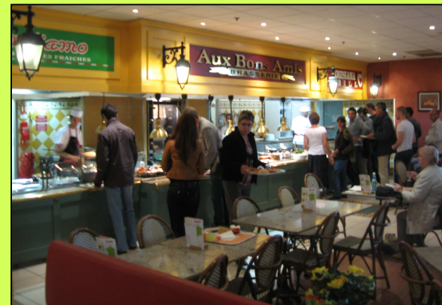
Crescendo de Bourg les Valence (26)