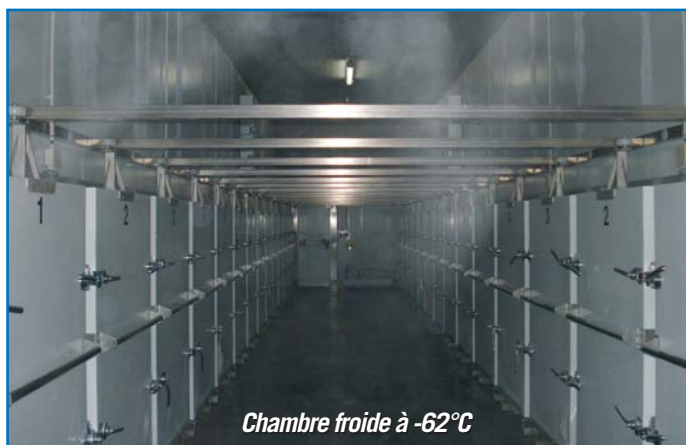
Chambre froide à -62°C

Jean-Louis BREGEAT : Les principaux risques sont liés à la température extrêmement basse et au manque d'oxygène dû à la transformation en se réchauffant de la neige carbonique (présente autour des ferments surgelés) en CO 2 .