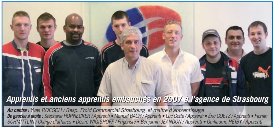
Apprentis et anciens apprentis embauchés en 2007 à l'agence de Strasbourg