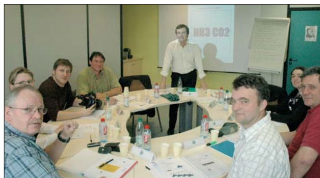
Formation interentreprises dans la salle Formation à Bischheim