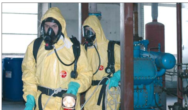
Brasserie La Licorne à Saverne (67)