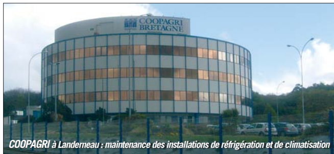
COOPAGRI à Landerneau : maintenance des installations de réfrigération et de climatisation

La glace en écaille est aussi utilisée dans les viviers. L'agence de Landivisiau installe actuellement pour la société BEGANTON (élevage de homards, tourteaux, langoustines, moules) un silo orbital de 7m de haut, 2.5m de diamètre et d'une capacité de 4 tonnes de glace en écailles. La glace est ensuite acheminée pneumatiquement vers les différents lieux d'utilisation.