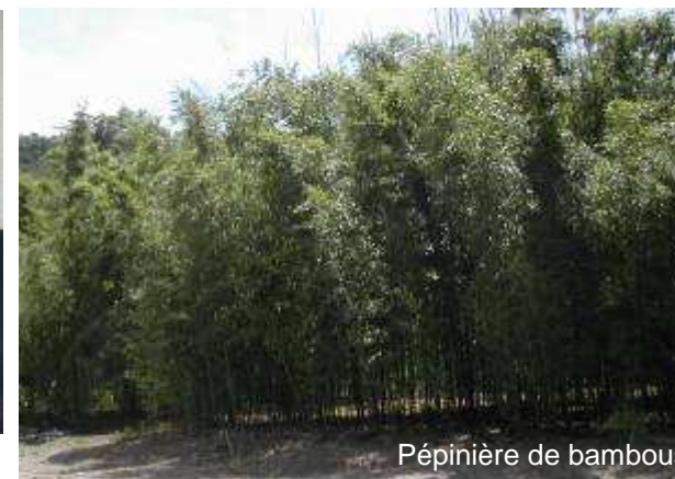
Pépinière de bambous