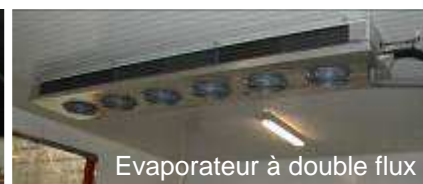
Evaporateur à double flux